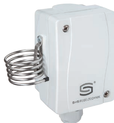
TR 040 U TR 060 U (un étage) TW