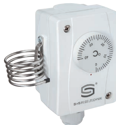
TR 040 TR 060 (un étage) TR